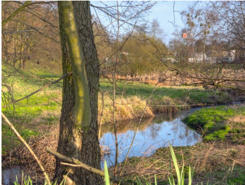
Buschgrabenbecken in Zehlendorf 2012

Die eiszeitliche Rinne des Buschgrabens zieht sich ursprünglich vom Vierling, einem Teich nördlich der Krümmen Lanke bis zum Teltowkanal südlich des Augustinums. Auf Berliner Gebiet ist sie größtenteils verschüttet und überbaut. Überreste sind in Zehlendorf mit dem Tränkepfuhl beim Gut Düppel und dem Buschgrabenbecken zwischen S-Bahntrasse (S1), Königsweg und Hegauer Weg erhalten geblieben. Ab dem Königsweg, dem sogenannten Buschgrabenbecken, taucht dann wieder der Buschgraben auf, der hier vor allem der Aufnahme der Straßenentwässerung von Zehlendorf dient. Für die Renaturierung dieses Abschnittes engagieren sich unsere Berliner Freunde. Am Graben würden Büsche und Sträucher gepflanzt und es wurde ein Wanderweg angelegt.