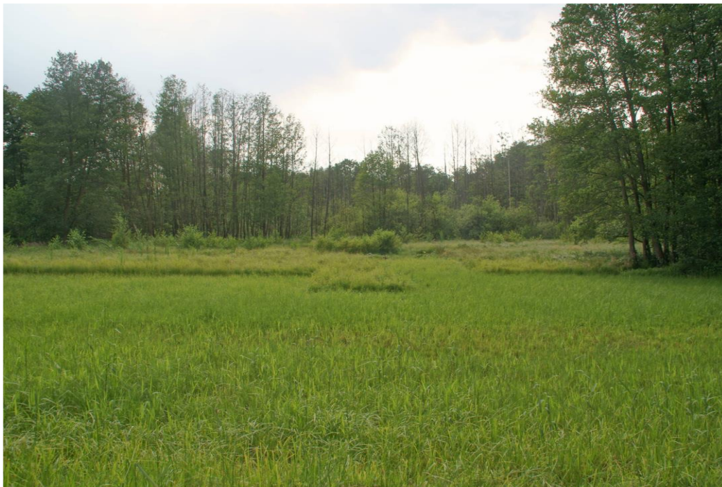
Beispiel für notwendige Pflege/Nutzung: vorne: gemähte Wiese, mitte: junger Erlenaufwuchs, hinten älterer Erlenaufwuchs – Übergang zum Erlenbruch. Ohne Pflege breitet sich der Erlenbruchwald über die ganze Fläche aus.

Der Förderverein greift auf einigen Flächen in den natürlichen Verlauf der Sukzession ein, um eine Vielfalt von unterschiedlichen Lebensräumen zu erhalten. Er leistet damit einen Beitrag zum Erhalt der Biodiversität.