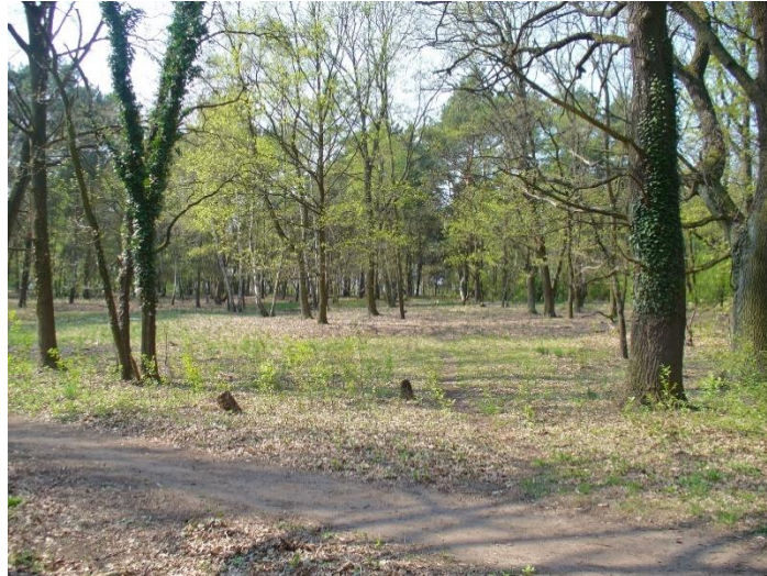
Südseite des Weinberges

Die letzte Eiszeit hinterließ an der Randzone der Gletscher aufgetürmte Sandmassen, die in Kleinmachnow den Weinberg formten. Davor das Tal der Bäke, in dem in der Eiszeit die Schmelzwasser abflossen und ein Sumpfbereich hinterließen.