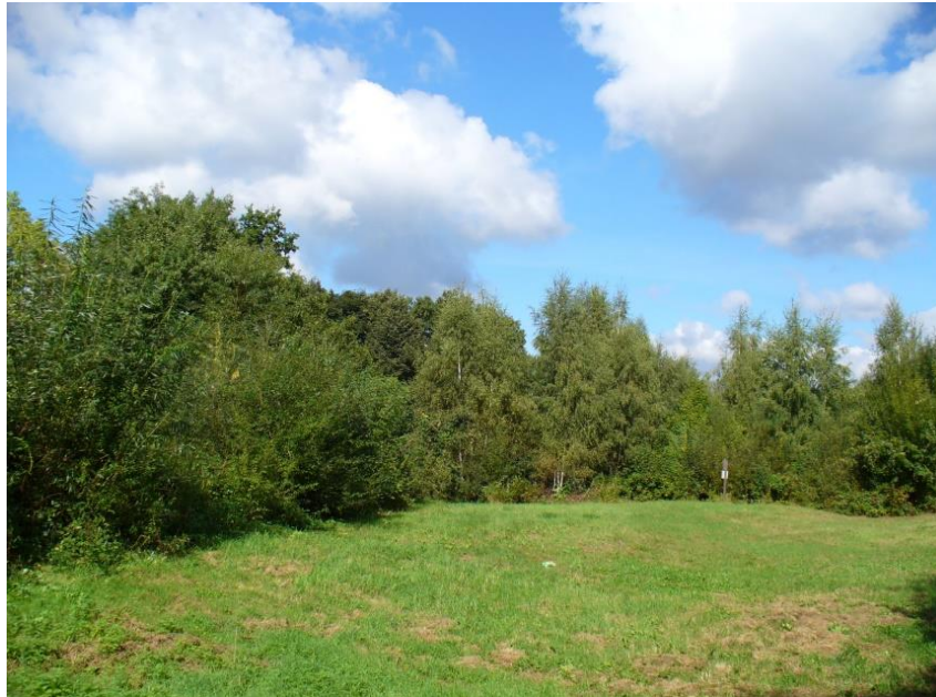
Wiese am Erlenweg, von einer Heckenpflanzung umgeben

Außerdem wurde verschiedene Gehölze gepflanzt, so dass im Lauf der Jahre ein bunter Gehölzstreifen entstand mit Feldahorn, Stieleiche, Roteiche, Linde, Rotbuche, Hainbuche, Birke, Esche, Rosskastanie, Ulme, Eberesche, Haselnuss, Weißdorn, Schlehe, Mirabelle, Flieder, Pfaffenhütchen, Jasmin und Wildrosen.