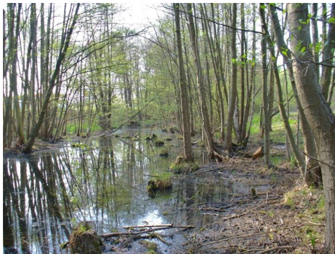
das Bäkefließ wischen Wilhelm-Külz-Straße und „Festwiese“

Das Großseggenried wird durch den Erlenwald begrenzt, der sich entlang des Bäkefließes hinzieht. Bittersüßer Nachtschatten ( Solanum dulcamara ), Große Brennessel ( Urtica dioica ), Knoten-Braunwurz ( Scrophularia nodosa ) und Zaunwinde ( Calystegia sepium ) treten hier auf.