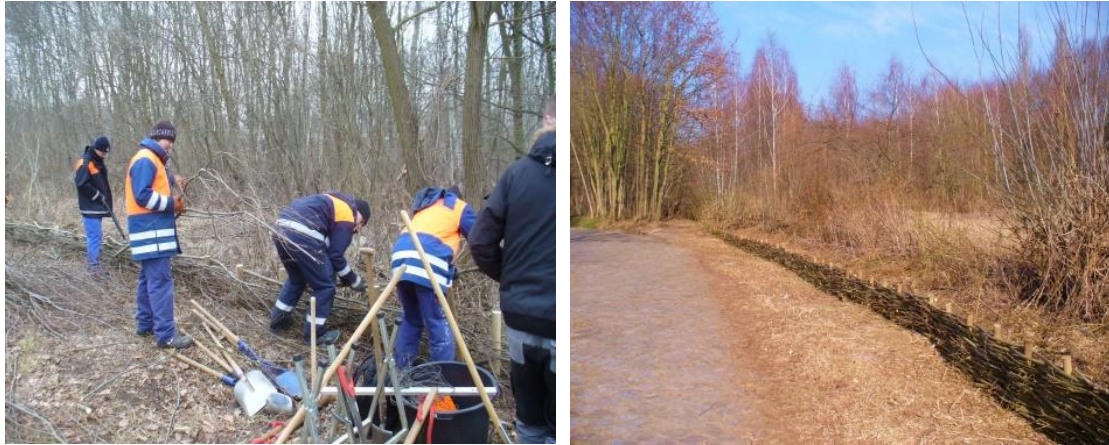
Lehrlinge der Wasserbauschule beim Bau eines Weidenflechtzauns

In jedem Jahr trafen sich Mitglieder des Fördervereins zum Pflegeinsatz an der Heckenanlage am Erlenweg. Die sehr stark wachsenden Weiden wurden auf etwa 1,80 m Höhe eingekürzt, um die Entwicklung zu Kopfweiden zu fördern und für die Vögel neue Nistmöglichkeiten zu schaffen. Mit den geschnittenen Weidenruten wurde die Schichtholzhecke ergänzt. Hilfe beim Beschneiden der Kopfweiden erhielt der Förderverein auch durch Lehrlinge der Wasserbauschule, die das Ernten und Verbauen von Weidenruten an Ort und Stelle üben konnten. Hier hatte sich eine sinnvolle Zusammenarbeit von praktischem Unterricht mit der Landschaftspflege entwickelt.