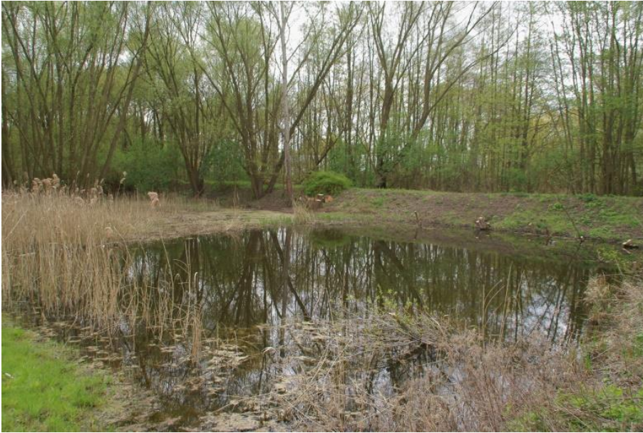
Laichteich im Bäketal im April 2016

Die Entwicklung der Amphibienbestände werden wir beobachten und dokumentieren.