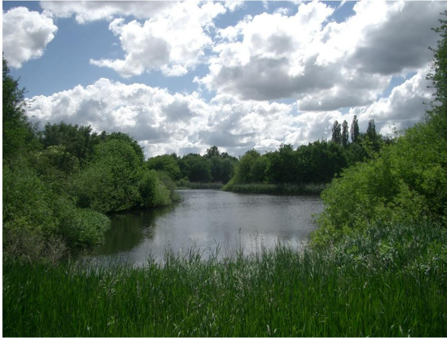
der Buschsee, Blick vom Nordufer