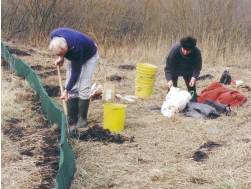
1993: Aufbau eines Krötenzaunes am neuen Laichteich im Bäketal

Auf Anregung des Fördervereins veranlasste Anfang der 90er Jahre die Gemeinde Kleinmachnow, dass am westlichen Ende des ehemaligen Spülfeldes im NSG Bäketal ein neues Kleingewässer angelegt wurde. Um die Besiedlung dieses Teiches zu erfassen, wurde 1993 dort ein Amphibienzaun aufgestellt und die zum Teich wandernden Amphibien registriert. Jeweils eine kleine Population der o.g. Arten hatte im neuen Teich abgelaicht.