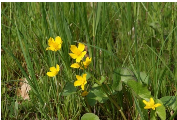
Sumpfdotterblume (Caltha palustris)