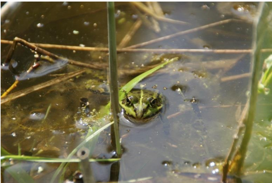
Teichfrosch im Laichteich

Am Gehölzrand nördlich des Teiches haben wir an einem besonnten Platz einen Haufen des abgemähten Grases von der Wiese deponiert. Solche Haufen werden von Ringelnattern gerne als Eiablageplatz genutzt. Am und im Teich wurden schon mehrfach Ringelnattern beobachtet.