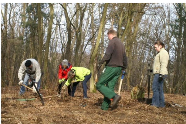
Ausgraben der Robienwurzeln durch Mitglieder des Fördervereins