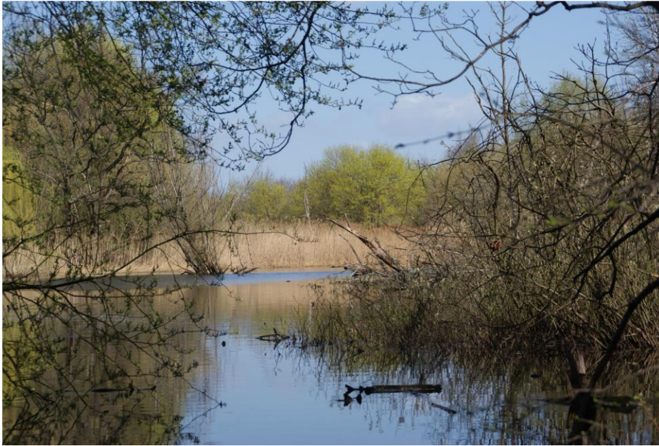
die teichartige Erweiterung des Buschgrabens nördlich vom Augustinum

Ende März 2013 fand der letzte Pflegeeinsatz am Buschgraben statt, da die Kleinmachnower Gemeindeverwaltung dem Förderverein aufgrund der privaten Eigentümerstrukturen den weiteren Zutritt auf das Gelände am Buschgraben untersagt hat, welches seit mehr als 20 Jahren durch unseren Verein gepflegt worden war. Der Förderverein versuchte ergebnislos mit den Eigentümern Kontakt aufzunehmen und sie um die Erlaubnis für die Pflegemaßnahmen des Vereins zu bitten.