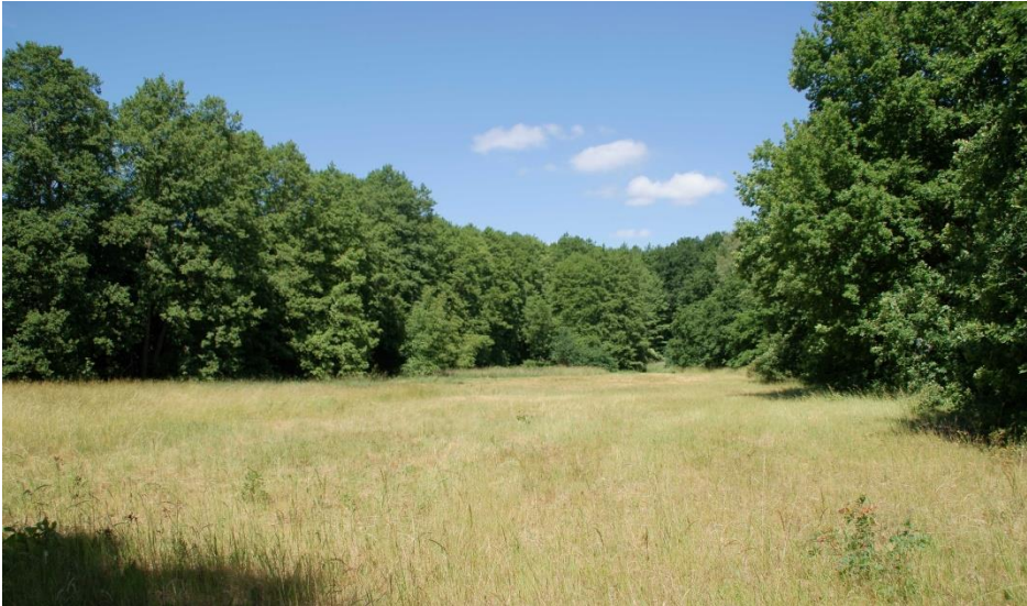
Blick von Süden auf die Wiese am Schwarzen Weg

Die Wiese am Schwarzen Weg ist etwa 7.000 m 2 groß und liegt an der südlichen Grenze von Kleinmachnow zu Stahnsdorf.