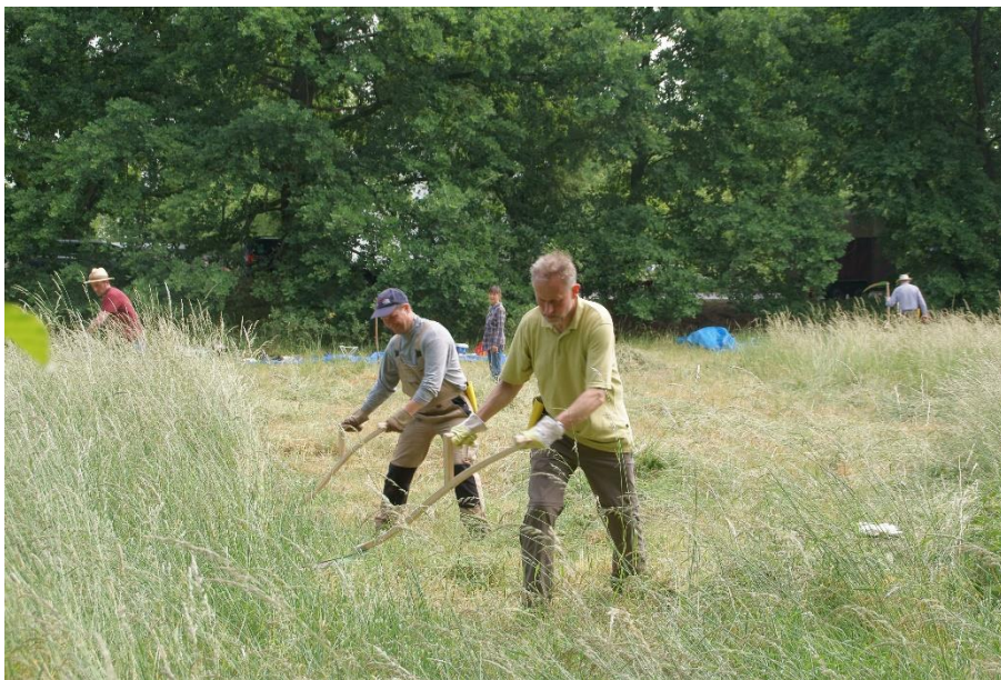
Wiesenmäh im Rahmen eines Sensenkurses

Seit 2013 wurde vom Förderverein Buschgraben/Bäketal e.V. annähernd die Hälfte der Wiese einmal jährlich gemäht und das Mähgut beräumt. Neben der Beseitigung von Müllablagerungen wurde mit dem Entfernen des Gehölzaufwuchses begonnen.