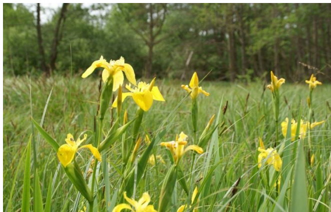
Sumpf-Schwertlilie (Iris pseudacorus) im Großseggenried

Die Feuchtwiese geht im westlichen Teil in einen Großseggenried über, in dem die bultig wachsende Rispensegge ( Carex paniculata ) Aspekt bildend ist. Dazwischen wurden folgende Charakterpflanzen gefunden: Sumpfssegge ( Carex acutiformis ), Schnabel-Segge ( Carex rostrata ), Teich-Schachtelhalm ( Equisetum fluviatile ), Schmalblättriges Wollgras ( Eriophorum angustifolium ), Sumpfkrazdistel ( Cirsium palustre ), Ufer-Wolfstrapp ( Lycopus europaeus ), Sumpf-Schwertlilie ( Iris pseudacorus ), Fluß-Ampfer ( Rumex hydrolapathum ), Großer Rohrkolben ( Typha latifolia ) und Flatter-Binse Juncus effusus ).