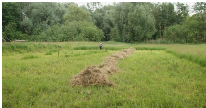
Mitglieder des Fördervereins bei der Wiesenpflege

Im westlichen Teil können sich Großseggen und Hochstauden ausbreiten, Hohe Bulten wechseln sich mit knietiefen Wasserlöchern ab. Hier entfernt der Förderverein alle aufwachsenden Bäume und Sträucher.