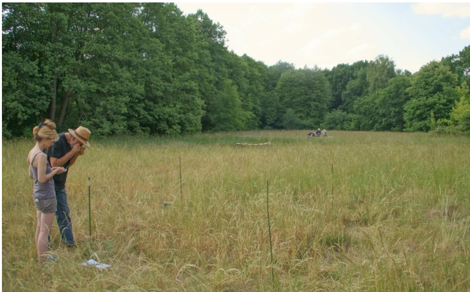
Mitglieder des Fördervereins bei der Kartierung

Außerdem werden zu diesem Termin von den Helfern unter Anleitung von Fachleuten auch alle Pflanzenarten erfasst.