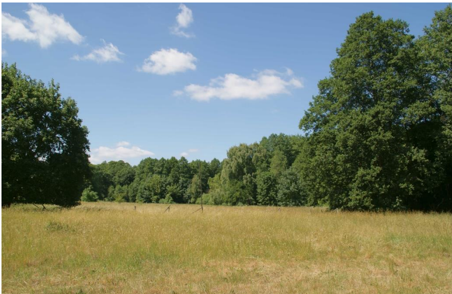
Blick nach Westen zu den Stahnsdorfer Wiesen

Im Westen, auf Stahnsdorfer Gebiet schließen sich weitere Wiesen an, die aber nicht zum NSG Bäketal gehören.